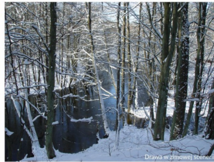
Drawa w zimowej scenarii