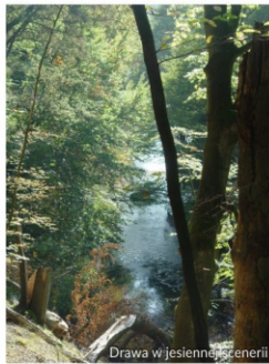
Drawa w jesiennym scenarii