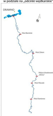
Mapa Drawy w granicach DPN w podziale na „odcinki wędkarskie”

To urozmaicenie warunków hydrologicznych ma również odzwierciedlenie w bogactwie siedlisk i gatunków roślin i zwierząt tej pięknej rzeki. Ichtiolodzy stwierdzili występowanie w 27 gatunków ryb, wśród nich tak cenne jak kosa, piekielnica, strzebla potokowa, różanka, goltwacz białopłetwy, lipień, pstrąg potokowy. Respektowanie ustalonych zasad korzystania z wód Parku pozwoli na przyszłość zachować niezwykle walory przyrody tego miejsca i jednocześnie uprawiać wędkarstwo tym, którzy będą tu chcieli przyjeżdżać. Zachęcamy wędkarzy do złożenia przysięgi.