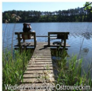
Wędkarz na jeziorze Ostrowieckim

Tak postępujących wędkarzy, z prawdziwą przyjemnością zapraszamy do Drawieńskiego Parku Narodowego