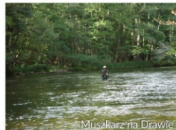
Muszkarcz na Drawie