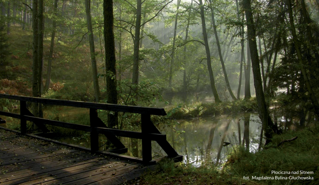
Plóćiczna nad Sitnem