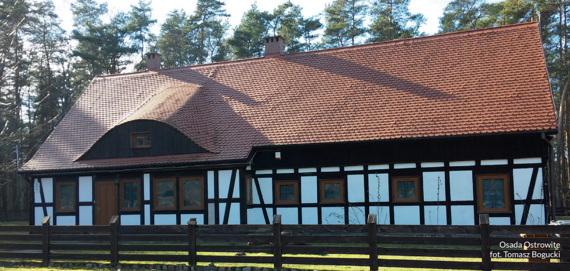
Osada Ostrowite