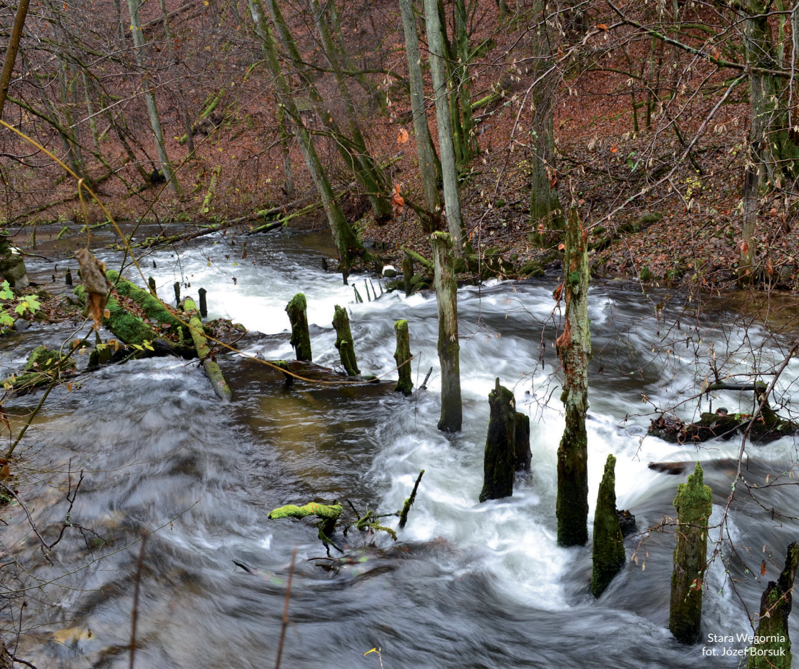
Stara Wegornia