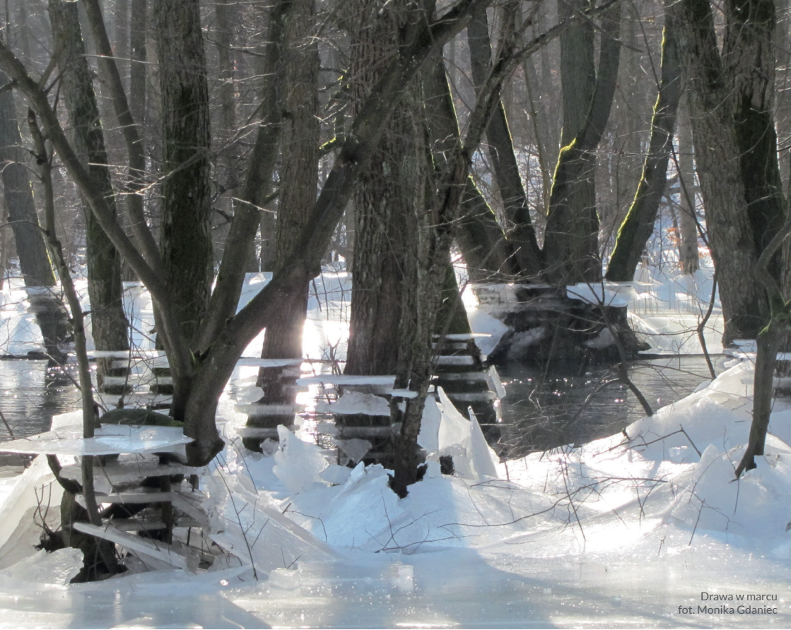
Drawa w marcu