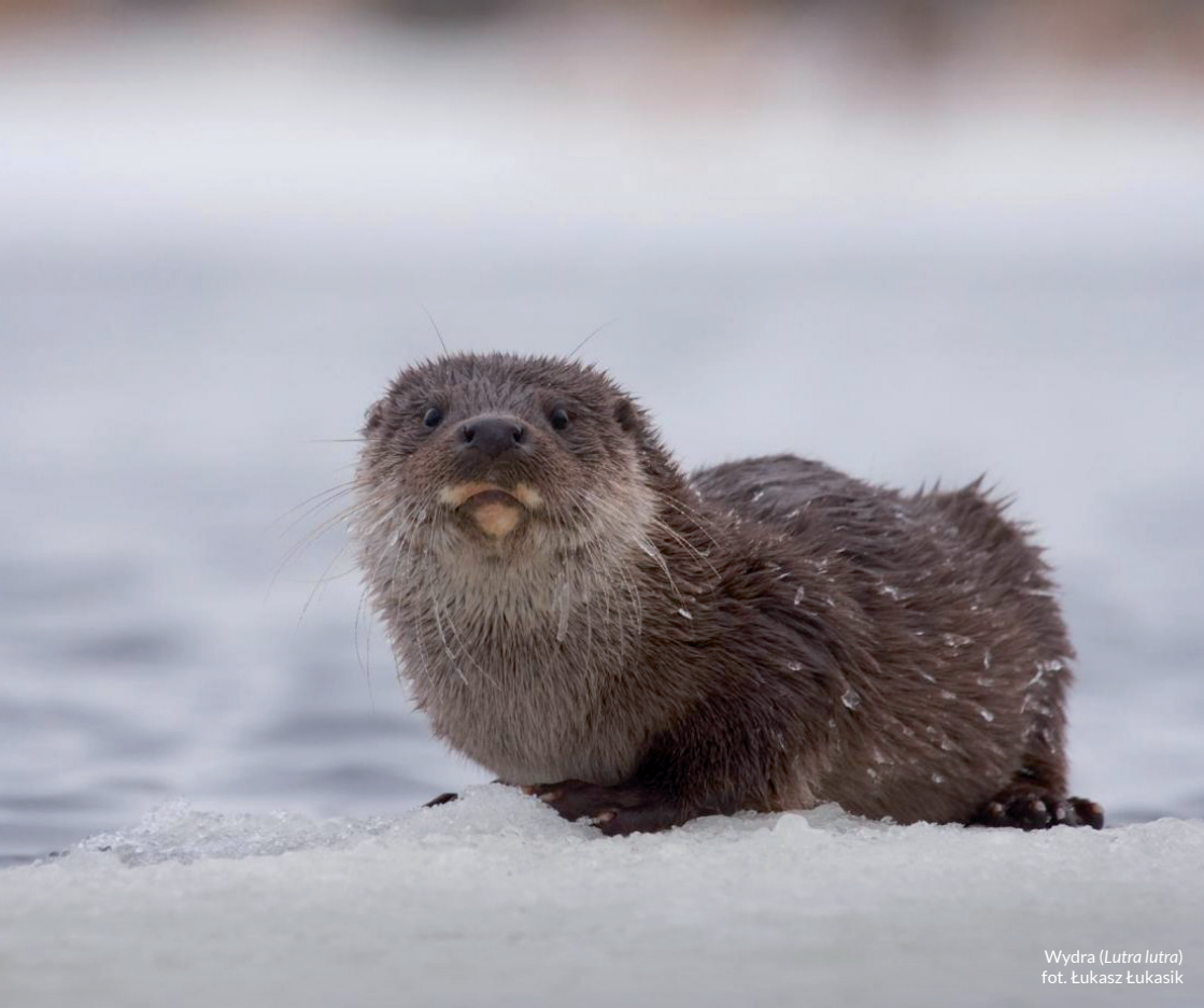
Wydra ( Lutra lutra )